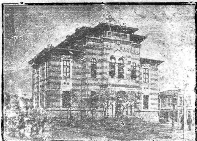
Palatul Comunal Constanța (vezi explicația)